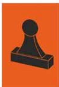
Zelfstempelaar (RC) Bemande (RC)