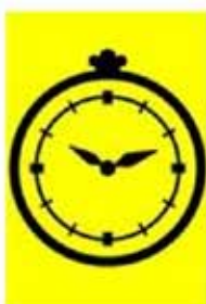
Tijdcontrole (TC) Tijdwisselcontrole (TWC)