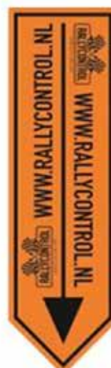
Pijl naar beneden wijzend, weg mag niet worden ingereiden