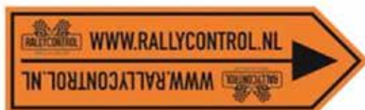
Dubbele pijl - einde omleiding / routerichting