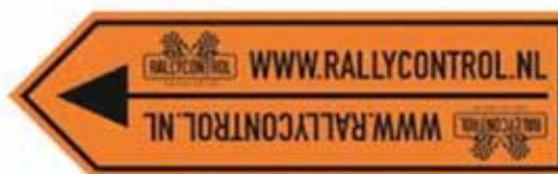
Dwangpijl (routerichting of omleiding)